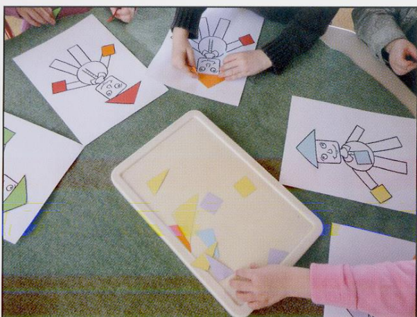
Poser les mains (les carrés) du « petit homme ».