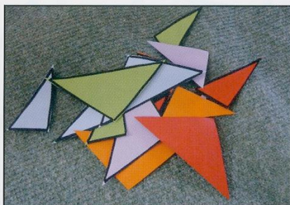
Trier les formes utilisées : les triangles.