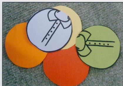
Trier les formes utilisées : les ronds.