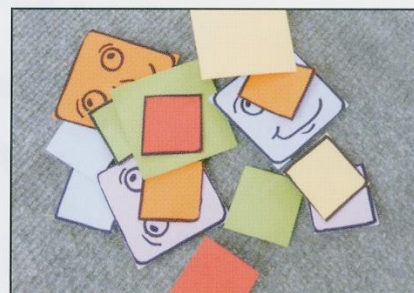
Trier les carrés.